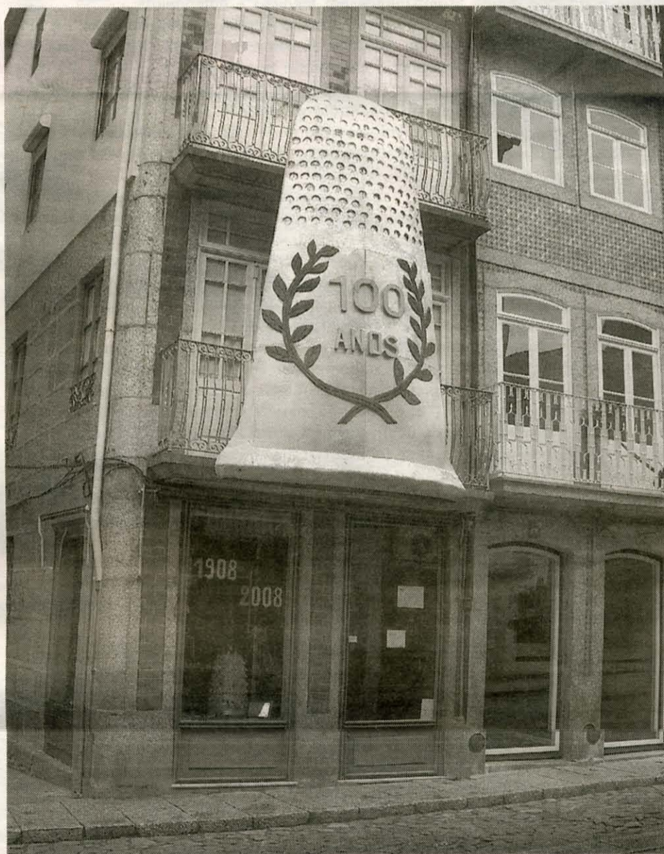
Alfaiataria Fernandes assinala este ano o centésimo aniversário

que uma profissão que atravessou várias gerações da família termine consigo. «Era bonito dar continuidade a esta profissão, mas o mundo não está parado e temos que aceitar as evoluções», afirma.